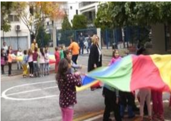
Τα παιδιά συμμετείχαν σε δραστηριότητες συνεργασίας, συμπερίληψης-μη αποκλεισμού